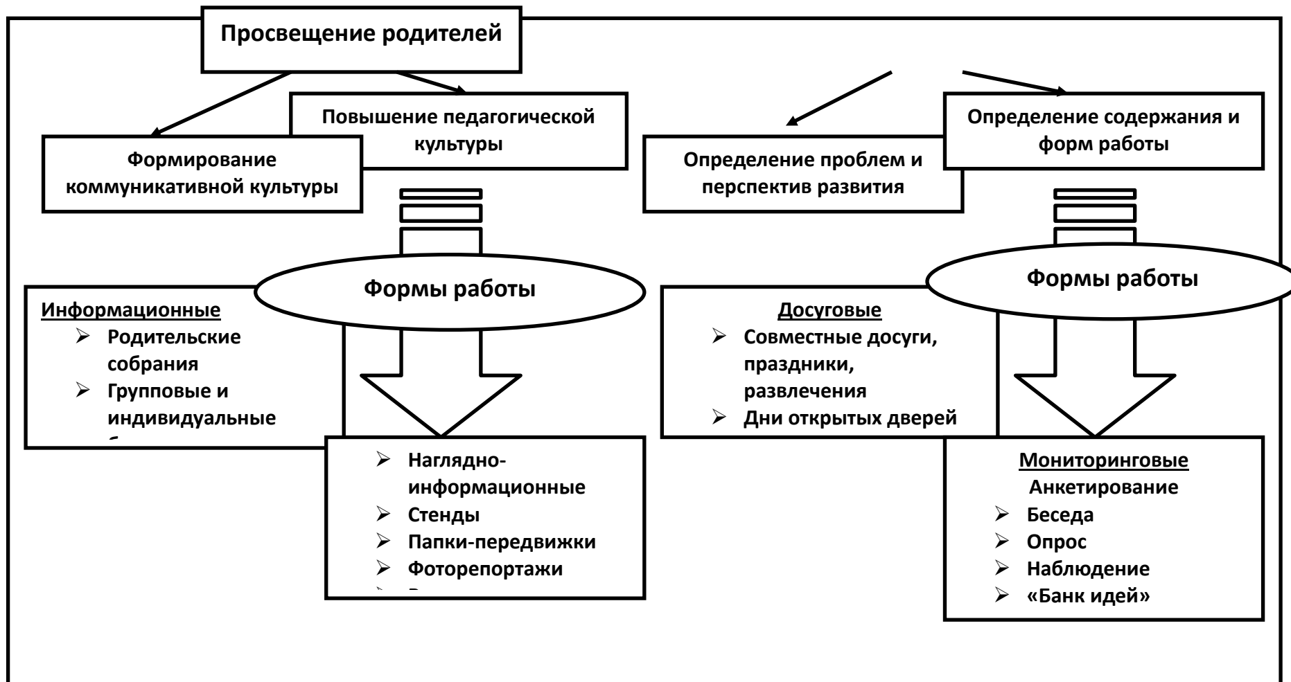
Модель взаимодействия с семьей